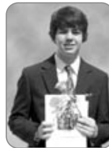
Kauern, im Mai 2012

Für die zahlreichen Glückwünsche und Geschenke anlässlich