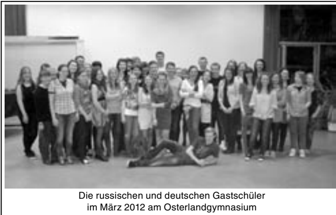
Die russischen und deutschen Gastschüler im März 2012 am Osterlandgymnasium

Mit großer Spannung fuhren dann 22 Schüler in Begleitung des amtierenden Schulleiters Herrn Kückler sowie Frau Staudte und Frau Jung im September 2011 nach Petrosawodsk.