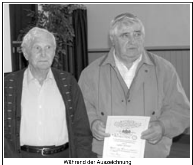
Während der Auszeichnung