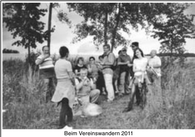
Beim Vereinswandern 2011

13:00 Uhr Familienwanderung für alle Mitglieder, Einwohner und Freunde