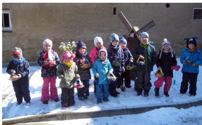
Die Mäusekinder haben bei Familie Stoike im Garten gesucht (Kita Meilitz)

Alle Kinder und Erzieher der Kitas „Regenbogen“ Wünschendorf und „Bussi Bär“ Meilitz