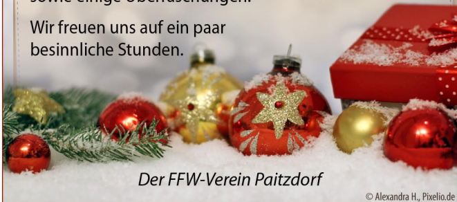
Der FFW-Verein Paitzdorf

Wir freuen uns auf ein paar besinnliche Stunden.