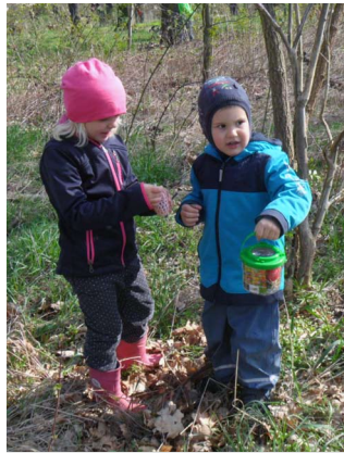
Die Krümel-Kinder bestaunen ihre gefundenen Eimerchen

Die Geflügelzüchter aus Wünschendorf haben uns viele Eier gebracht, so dass ein jedes Kind hat gelacht.