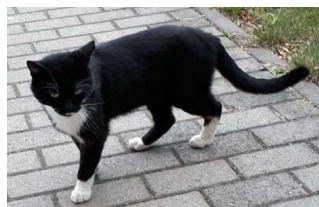
Kater und Katze Zugelaufen in Großebersdorf