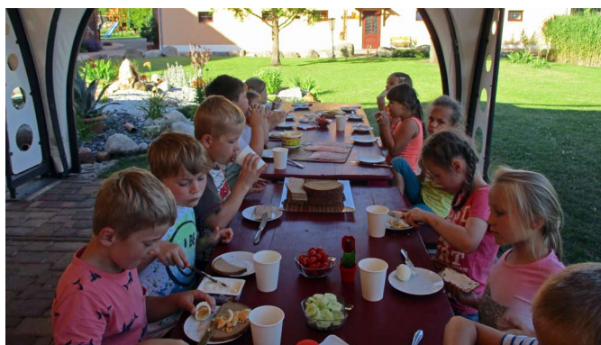
Nach dem Schlafen auf dem Heuboden gibt es Frühstück auf dem Probst Hof

Seit vielen Jahren ist es bei uns Tradition, dass die Schulanfänger vor dem Zuckertütenfest mit ihren Erziehern einen Ausflug mit Übernachtung unternehmen. Auch schon einige Jahre gibt es den Kinderkleidermarkt, der von unseren Eltern im Frühjahr und im Herbst ganz alleine organisiert und liebevoll durchgeführt wird. Von den Spenden des Kleidermarktes konnten wir am 27. Juni 2019 wieder einen tollen Ausflug zum Probsthof nach Schmölln unternehmen.