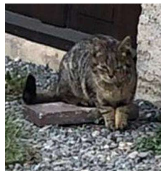
Scheuer Kater oder Katze Das ca. sechs Monate alte Tier lässt sich nicht streicheln und ist 07570 Harth-Pöllnitz zugelaufen.

Bitte meldet euch bei Facebook, tierheim-weida@web.de oder sprecht auf unseren Anrufbeantworter 036603 238805. Es wäre uns eine große Hilfe.