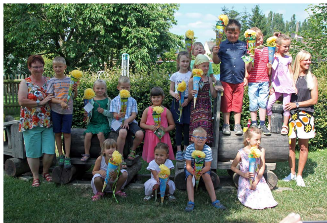
Unsere Schulanfänger mit ihrer Zuckertüte

Aber unsere Schulanfänger blieben dort im Probst Hof. Sie hatten noch einen tollen Nachmittag, schliefen im Schlafsack auf dem Heuboden einer ausgebauten Scheune und kamen erst am nächsten Tag in die KITA zurück. Hier wurden sie feierlich empfangen und traditionsgemäß mit der Schubkarre aus der KITA „rausgeschmissen“. Dann gab es die langersehnten Zuckertüten.