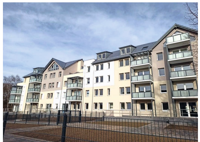
Langsam nehmen auch die Außenanlagen Gestalt an.

Nur noch sehr wenige Wohnungen sind frei. Sollten auch Sie Interesse haben, dann schnell gemeldet in der Wohnungsverwaltung der Verwaltungsgemeinschaft Wünschendorf!