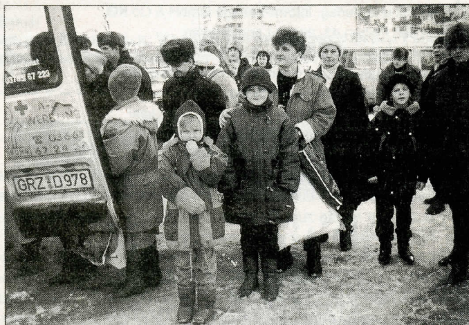
Glückliche Gesichter in Rußland

Auch wir sammelten in der Zeit vor Weihnachten Kleidung, Nahrung, Medikamente und Geld für die vielen krebskranken Kinder in Brest. Durch die Erlaubnis folgender Geschäfte, welchen wir hiermit danken wollen (Schmuckgeschäft Wagner, Fernseh Berger, Apotheke Seyfarth, Drogerie Hamdorf, Heyne, Videothek Wetzels, K&M Feinkostgeschäft, Schreibwarengeschäft Kretschmar, Blumenladen Strobel) war es uns möglich im Rahmen einer Sammelaktion 509,- DM für die Selbsthilfeorganisation „Kinder in Not“ zu sammeln.