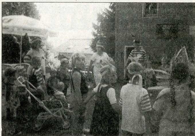
Die Teams der Kita's Pustebume, Am Wald und des Spatzennestes i. A. C. Kurze