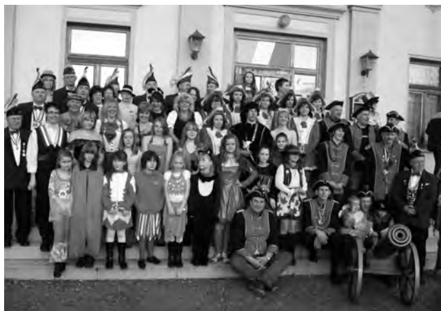
Hiermit verabschieden wir uns bis zur 48. Saison mit einem dreifach donnernden