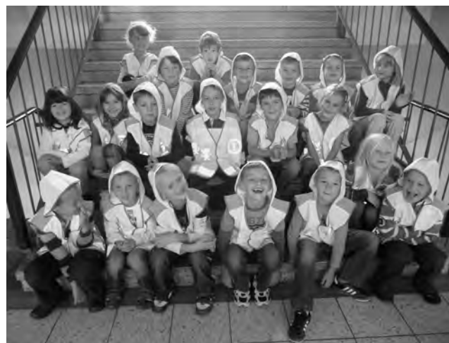
Klasse 1 der Staatlichen Grundschule Berga mit ihren neuen Westen