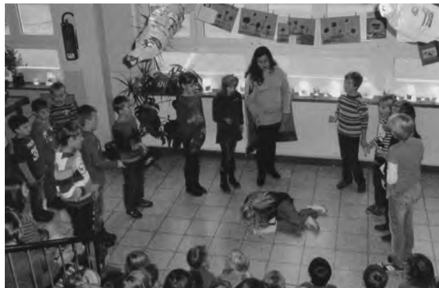
Kl. 4 gestaltet das Mini-Musical „St. Martin“