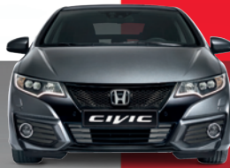
CIVIC 1.4 COMFORT: 15.999€ 7.999€*