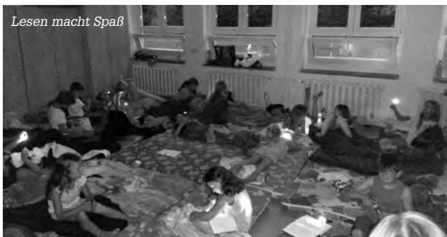
Lesen macht Spaß

Nun haben wir es endlich geschafft. 6 Wochen Ferien „stehen vor der Tür“. Doch zuvor gab es eine schöne Lesenacht in der Schule. Neben Pizzaabendessen und Lesen erlebten wir noch eine beeindruckende Gewitternacht. Trotz Blitz und Donner schliefen wir tief und fest, bis am nächsten Morgen die Kinder aus den anderen Klassen kamen und uns die Schulklingel weckte.