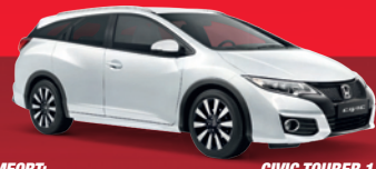
CIVIC TOURER 1.6 S iDTEC: 17.999€ 8.999€*

Zahlen Sie 50%* für einen neuen Honda CR-V, Civic oder Civic Tourer (Anzahlung kann auch Ihr Gebrauchter sein) und fahren Sie 3 Jahre lang ohne Zinsen, ohne Raten. Danach können Sie sich entscheiden: den Rest zahlen, den Rest finanzieren oder den Wagen einfach zurückgeben*. *50% des Hauspreis der W&H Autohaus GmbH & Co. KG **gemäß Rückkaufbedingungen