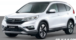
CR-V 2.0 COMFORT 2WD: 20.999€ 10.499€*

In drei Jahren den Rest zahlen, finanzieren oder zurückgeben.