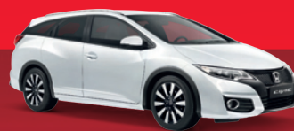
CIVIC TOURER 1.6 S i-TEC: 17.999€ 8.999€*

Zahlen Sie 50%* für einen neuen Honda CR-V, Civic oder Civic Tourer (Anzahlung kann auch Ihr Gebrauchter sein) und fahren Sie 3 Jahre lang ohne Zinsen, ohne Raten. Danach können Sie sich entscheiden: den Rest zahlen, den Rest finanzieren oder den Wagen einfach zurückgeben*. *50% des Hauspreis der W&H Autohaus GmbH & Co. KG. **gemäß Rückkaufbedingungen