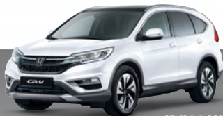
CR-V 2.0 COMFORT 2WD: 20.999€ 10.499€*

In drei Jahren den Rest zahlen, finanzieren oder zurückgeben.