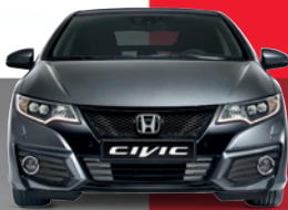
CIVIC 1.4 COMFORT: 15.999€ 7.999€*