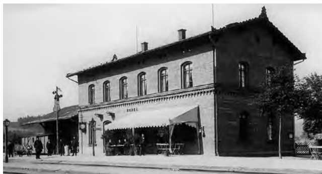
Das Empfangsgebäude des Bergaer Bahnhofs um 1890 In der Mitte des Bahnsteiges links steht noch ein altes „Peronsignal“ zur Ausfahrt in zwei Richtungen, welches 1906 durch richtige Ausfahrtsignale ersetzt wurde.

Der Bergaer Maurermeister Thomas erbaute die Bergaer Bahnhofgebäude. Da die Baufirmen an Geldmangel litten, wurde es Maurermeister Thomas hoch angerechnet, dass er geduldig auf die Bezahlung von 45.000 Mark wartete (2 Jahre lang) bis die Eisenbahn fertig in Betrieb war und 1876 von Sachsen gekauft wurde.