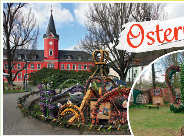
Osterkrone im Park