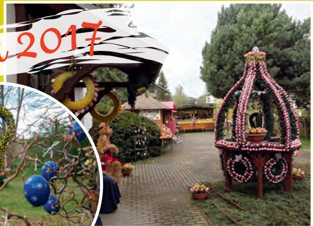
Osterausstellung Bahnhofstraße 27