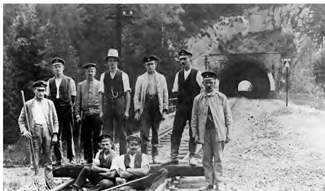
Gleisarbeiter beim Eisenbahnbau – Jahr 1876? vor dem Rüßdorfer Tunnel? Die Breite des Tunnels war schon damals vorgesehen für eine zweispurige Ausführung der Strecke