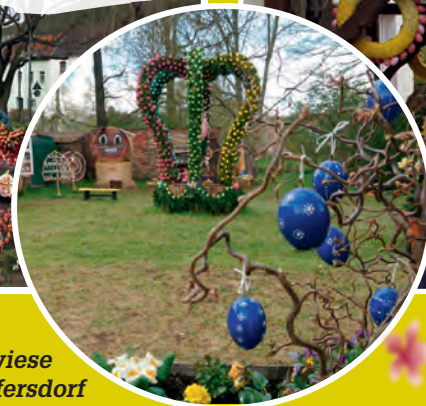
Osterwiese in Wolfersdorf