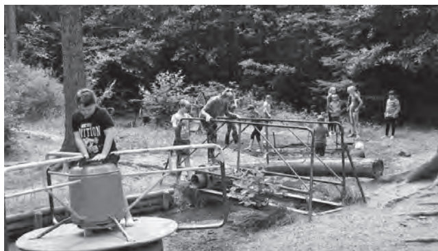
Waldsportplatz in Stöcken