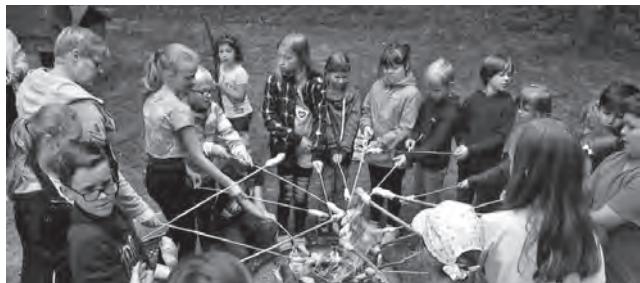
Stockbrot und Würstchen grillen mit unseren Schulanfängern

An zwei verschiedenen Tagen haben wir die neuen Schulanfänger eingeladen, um uns besser kennen zu lernen. Es wurden Boote selbst gebaut und im Pöltzschbach zu Wasser gelassen und gemeinsame Experimente mit Luftballons, Wasser, Marshmallows und Gummibärchen gemacht. Das Stockbrot- und Würstchengrillen war auch ein tolles Erlebnis und hat allen Kindern sehr gut geschmeckt.