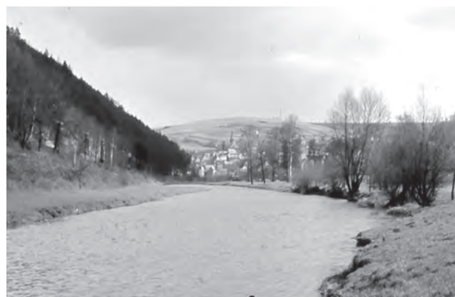
Die Elster im Bild vorn mit Blickrichtung flussaufwärts. Im Hintergrund die Stadt Berga – 1962

Bei Wünschendorf, dort, wo jetzt die Eisenbahnbrücke über die Elster führt, befand sich ein solcher Rechen. Dieser war ein gewaltiges Balkengerüst, das auf Holzjochen ruhte und zugleich als Steg diente. Von diesem Balkengerüst war eine große Menge starker Baumstämme schräg flussaufwärts in die Elster geschoben, die alles Floßholz aufhalten mussten. In Leipzig befand sich dann ein Floßgraben, wo alles Holz aufgesammelt, herausgezogen und zu Klaftern aufgesetzt und verkauft wurde. Im April lagen die Scheite manchmal hoch aufgetürmt vor dem Rechen und deckten die Elster bis zur Einmündung des Fuchgrabens vollkommen zu. Der Floßmeister, der den gesamten Floßverkehr auf einem bestimmten Stück der Elster regeln musste, gab dann dem Rechenmeister mit seinen Gehilfen den Befehl, den Rechen aufzuziehen, damit eine bestimmte Menge Holz abwärts weiter gefloßt werden konnte. Es musste sorgfältig vermieden werden, dass entweder zu viel oder zu wenig Holz abwärts gefloßt wurde, und bei Tag wie auch zuweilen bei Nacht hatten der Floßmeister und der Rechenmeister darauf zu achten. Bei Crossen an der Elster befand sich abermals ein Rechen, doch durften hier höchstens 4000 Klafter aufgestaut werden. In manchen Jahren wurden auf der Elster bis 40.000 Klafter Holzscheite gefloßt.