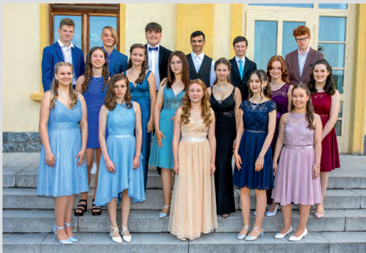
Klasse 8 a

In unserer Stadt fanden in den letzten Tagen und Wochen wieder zahlreiche Veranstaltungen statt. Ein besonderer Höhepunkt waren die beiden Jugendweiheveranstaltungen im städtischen Kulturhaus (siehe Fotos). Ein großes Dankeschön geht hierfür an die Organisatoren und Veranstalter, die Interessengemeinschaft Kultur für Berga (weitere Informationen im Innenteil dieser Zeitung).