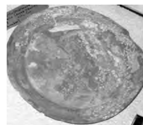
Foto: Fundstück – Zinnteller der Familie Lorenz – Schuhmacher, gefunden im Grundstück Berga Gartenstraße, vom Stadtbrand 1842, womöglich ein Meisterteller dieser Zunft? Im unteren Tellertrand noch leicht lesbar „...orenz“

Nach der Probe oder Mutzeit (zur Erlangung des Meisterrechtes) hatte der Geselle vor versammeltem Handwerk unter Vorsitz des Zunftmeisters sein Meisterstück zu machen. Wenn dieses für gut befunden wurde und eine eigene Werkstatt nachgewiesen werden konnte (dies war in der Regel nur durch Erbe, Einheirat oder den Kauf einer durch Tod eines Meisters freigewordenen Stelle möglich), wurde der neue Meister nach Ablegung seines Eides, das Handwerk zu stärken, sich den Zunftregeln zu unterwerfen und dem Wohl der Stadt zu dienen, feierlich in die Gemeinschaft der Zunftgenossen aufgenommen, wobei er seinen Mitmeistern auf eigene Kosten ein standesgemäßes Mahl auszurichten und in die Zunftkasse eine Summe einzuzahlen hatte.