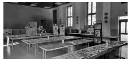
Internationale Galerie der kleinen Künstler

Nach der Kirmes ist vor der Kirmes! Und schon sind wir Vereinsmitglieder dabei, die „Jubiläums-Kirmes“ im Jahr 2025 vorzubereiten.