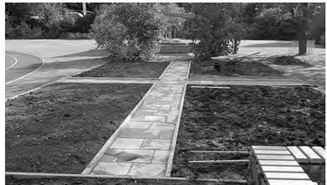
Nach der Fertigstellung

Wir, das gesamte Team der Staatlichen Grundschule Berga, möchten uns an dieser Stelle von ganzem Herzen für diesen Einsatz bedanken: Neben der Bereitstellung und dem Transport der Materialien sowie der Unterstützung mit Maschinen brachten fleißige Handwerker unseren Schulgarten schnell und effektiv auf einen modernen Stand.