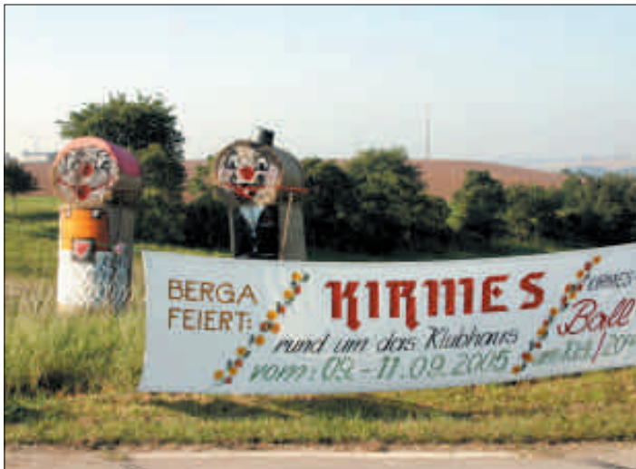
Berga erwartet seine Kirmesgäste

Ein umfangreiches, vielseitiges Programm gestaltete der Brauchtums- und Kirmesverein in Zusammenarbeit mit Vereinen, Verbänden, den Schulen, dem Kindergarten, der Kirche und vielen, vielen fleißigen Helfern in der Zeit vom 4. - 11.09.2005.