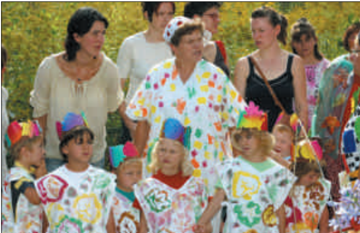
Erwartungsvolle Spannung vor dem Festzumzug