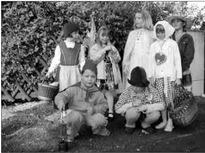
Die Darsteller aus dem Märchen »Schneewittchen«

Bei sommerlichen Temperaturen bekam die Grundschule, unter Anteilnahme vieler Gäste, am vergangenen Wochenende ihren Namen verliehen: »Gebrüder-Grimm-Grundschule«.