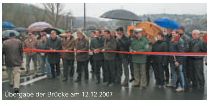
Übergabe der Brücke am 12.12.2007