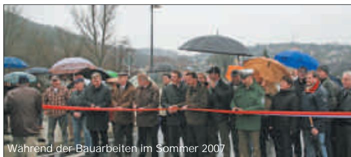
Während der Bauarbeiten im Sommer 2007

Am 12.12.2007 wurde nach fast einjähriger Bauzeit die neue Spannbetonbrücke über die Elster eingeweiht. Wenn der Himmel auch weinte, die Bergaer tatens nicht. Die 63 Meter neue Strecke der B175 sind nun besser denn je zu befahren, Im Frühjahr werden auch noch Fußgänger- und Radweg sowie das Pegelhaus gebaut. Ein Lob an die beteiligten Firmen, die durch eine intelligente Planung die Belastungen für die Bürger in Grenzen hielten. Mit dem Abriss der Behelfsbrücke wurde begonnen.