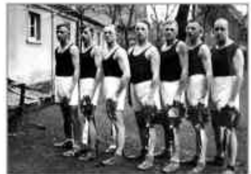
Männerriege vor dem Festumzug, 1932