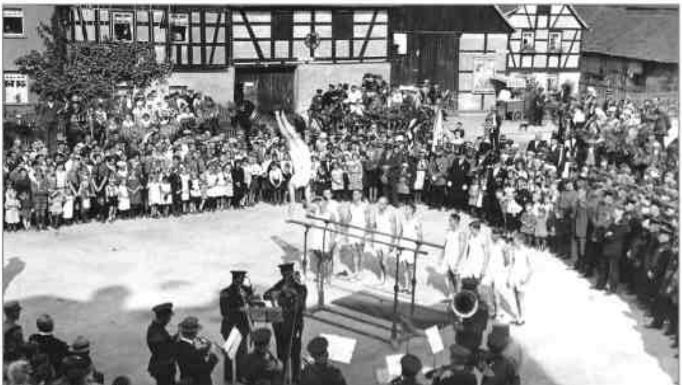
Turnen auf dem Weidenplatz, 1932