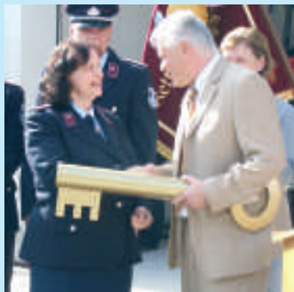
Bürgermeister Jens Auer überreicht den Schlüssel des neuen Gerätehauses