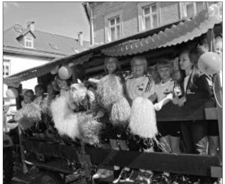
Kirmesumzug Berga/Elster 2008