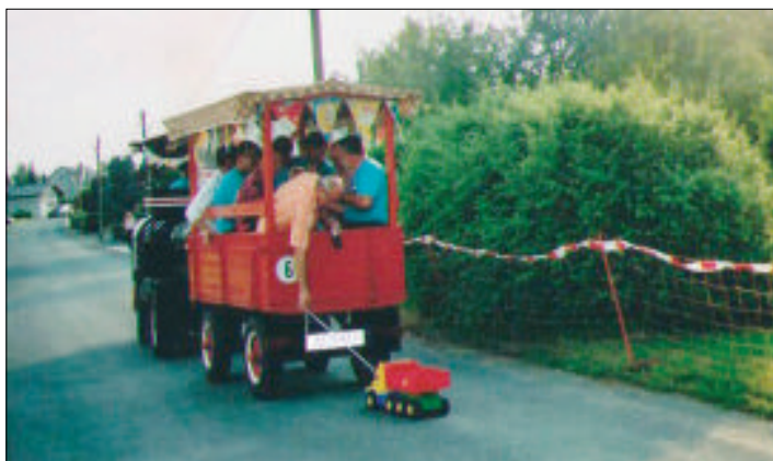
Männer beim Ausflug und alte Zossener erzählen