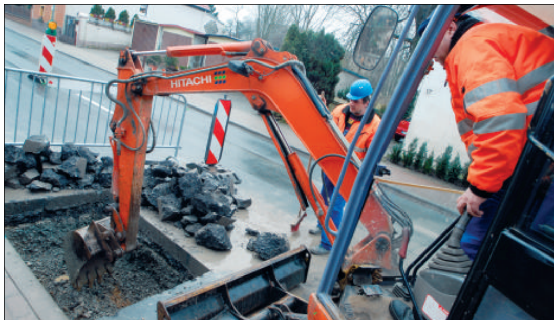
Alte Blei-Hauswasserleitungen sollten ausgewechselt werden.

Gaswerkstraße 10, 07546 Gera E-Mail: geschaeftsstelle@zvme.de Internet: www.zvme.de