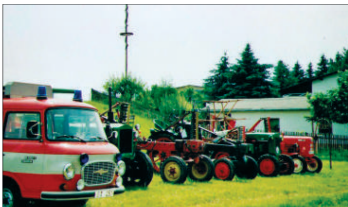
Fahrzeugausstellung und Wettbewerb im Kirschkernelweitspucken