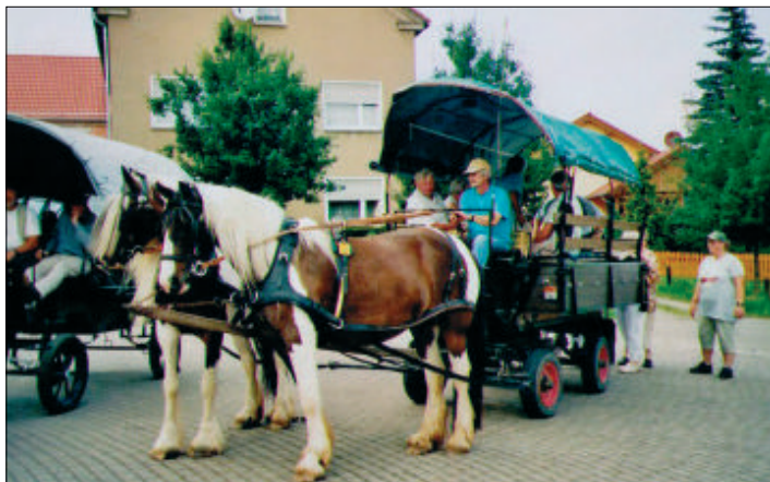
Seniorenfahrt per Kremser

Unser kleines Dorf feierte am 4. und 5. Juli 2009 seine 800-Jahr-Feier mit fast allen seinen Einwohnern.