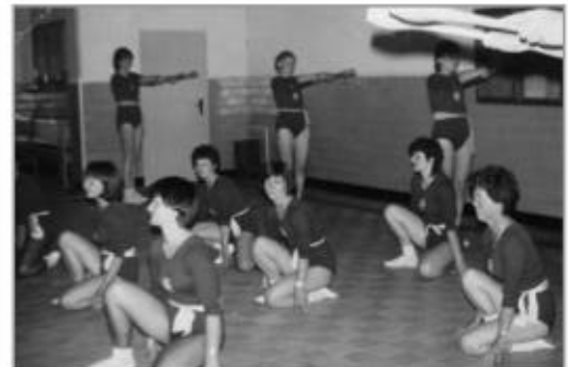
Gymnastikfrauen bei der Übung