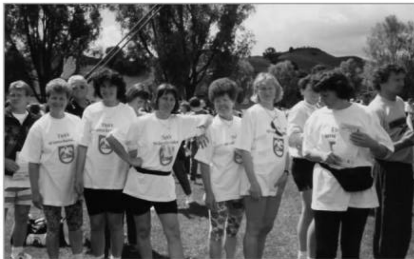
Sportfreundinnen beim Turn- und Sportfest in München, 1998