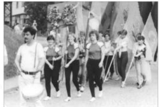
Umzug Gymnastikfrauen 40 Jahre BSG Stahl Wünschendorf, 1989