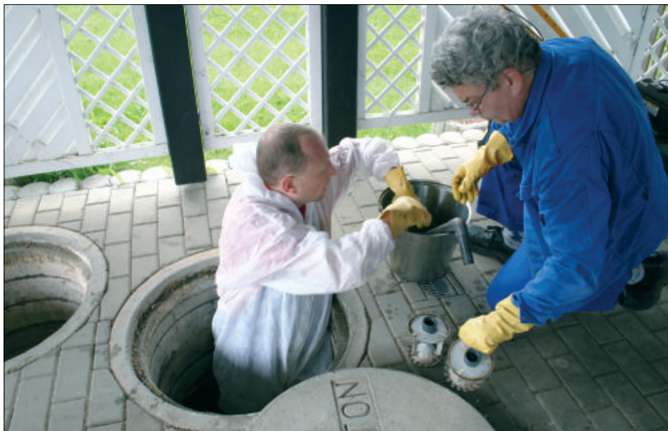
Auch die Zuständigkeit der Kontrolle der KKA wurde vom Gesetzgeber übertragen.

Sicherlich ist das nur interessant für all jene, die über eine Sickergrube verfügen oder deren Grundstücke über eine Klärgrube direkt an ein Gewässer oder einen Kanal angeschlossen sind. „Wird ein Grundstück in den nächsten 15 Jahren nicht angeschlossen und der Eigentümer bringt seine KKA durch Nachrüstung oder Erneuerung auf den Stand der Technik, erhält er für diese 15 Jahre einen Bestandsschutz, dass er nicht