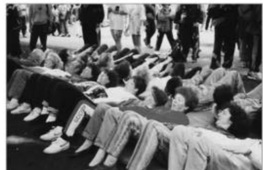
Wer hält diese Stellung am längsten aus? Sportfreundinnen bei den Massenwettkämpfen in Hamburg, 1994