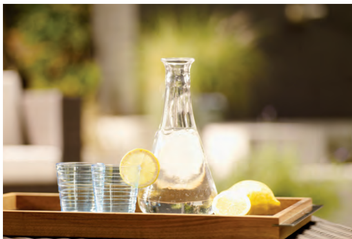
Frisches Trinkwasser das beste Getränk ganz besonders im Sommer

Thüringer Fernwasserversorgung und der ZVME bei einem Leitungsschaden bzw. anhaltender Trockenheit eine gewisse Zeit aus ihren zahlreichen zur Verfügung stehenden Hochbehältern Trinkwasser liefern. Selbst wenn es zu kurzzeitigen Spitzen in der Trinkwasserentnahme in den Haushalten kommt, ist nicht mit Versorgungsschwierigkeiten zu rechnen. Im Vergleich zu „normalen“ Tagen gab es selbst in den wärmeren Jahresabschnitten keine Probleme bei der Trinkwasserversorgung im Verbandsgebiet, zu denen der Entstörungsdienst des Dienstleisters OTWA