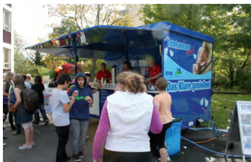
Dicht umringt ist sie immer – die Wasserbar von ZVME und OTWA